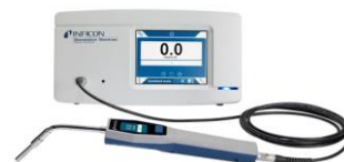
Sentrax Strix Edition