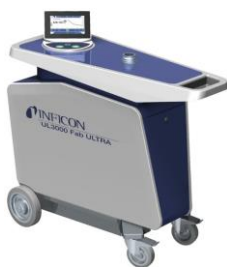
UL3000 Fab ULTRA